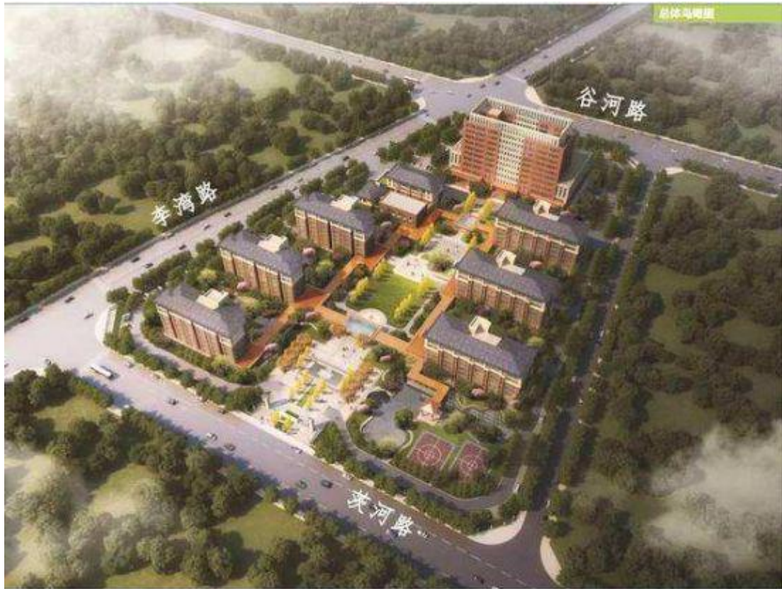
拟新建合肥市智慧养老中心规划鸟瞰图